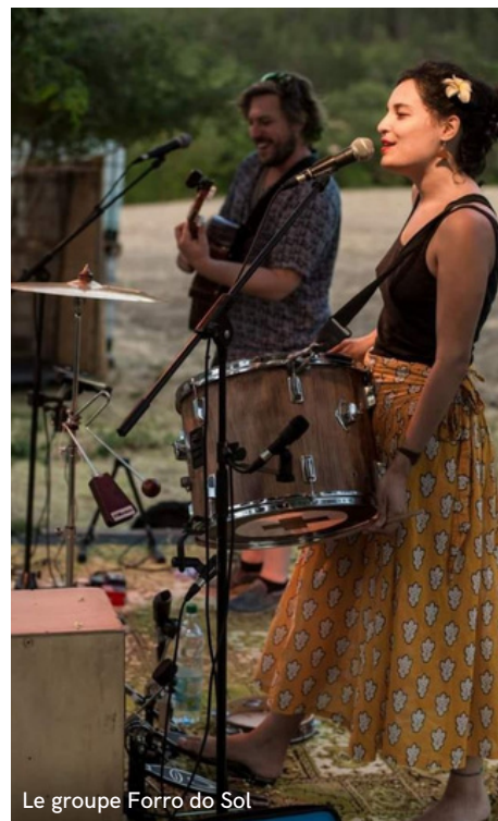
Le groupe Forro do Sol

Participation libre + buvette + Alimentation sur place / Monnaie du Ferréol