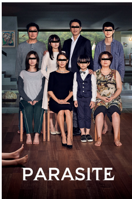
Parasite, ( Thriller, Comédie) Palme d'Or du Festival de Cannes 2019

https://www.facebook.com/cine.steja lle/